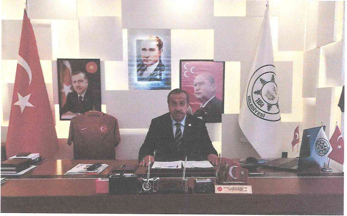
Rasim ÇAM BELEDİYE BAŞKANI